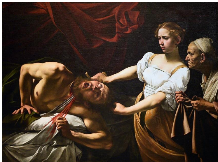
"Giuditta e Oloferne", Michelangelo Merisi da Caravaggio, 1599 ca., Palazzo Barberini

In occasione dell'Assemblea pubblica di A.d.D.U.